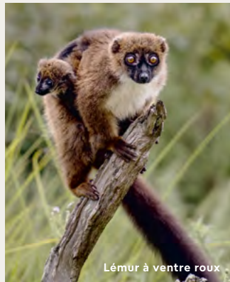
Lémur à ventre rouge

Primates originaires de Madagascar, la plupart des espèces de lémuriens sont menacées d'extinction en raison de la destruction des habitats forestiers.