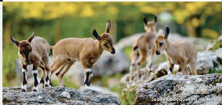
Jeunes bouquetins de Nubie