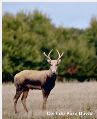
Cerf du Père David

Originaire de Chine, le cerf du Père David n'a jamais été observé dans la nature ! Il a été découvert au XIX e siècle dans les jardins du palais impérial de Pékin. Quelques individus envoyés en Europe sont à l'origine de toutes les populations actuelles.