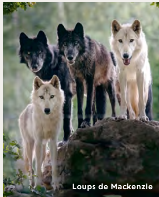
Loups de Mackenzie

C'est un carnivore au régime végétarien. La fragmentation de son habitat est la principale menace pour cette espèce dont les effectifs sont en diminution.